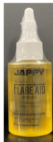
製品(シュリンク済)