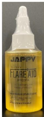
製品(シュリンク済)