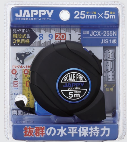
▲ ④ JCX-255N