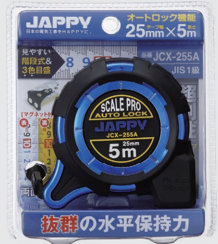
▲ ② JCX-255A