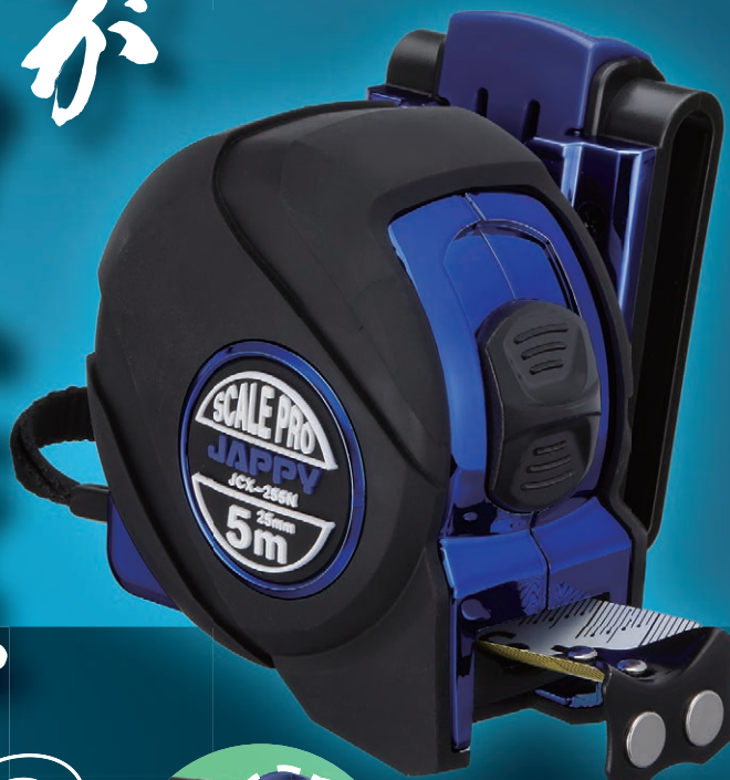
▲ JCX-255NH 手動ロック仕様