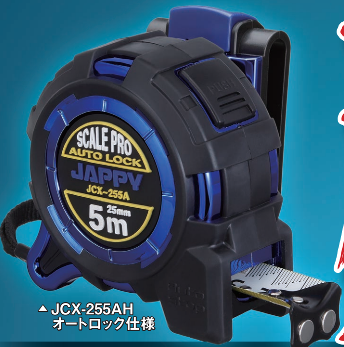
▲ JCX-255AH オートロック仕様