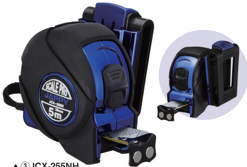
▲ ③ JCX-255NH