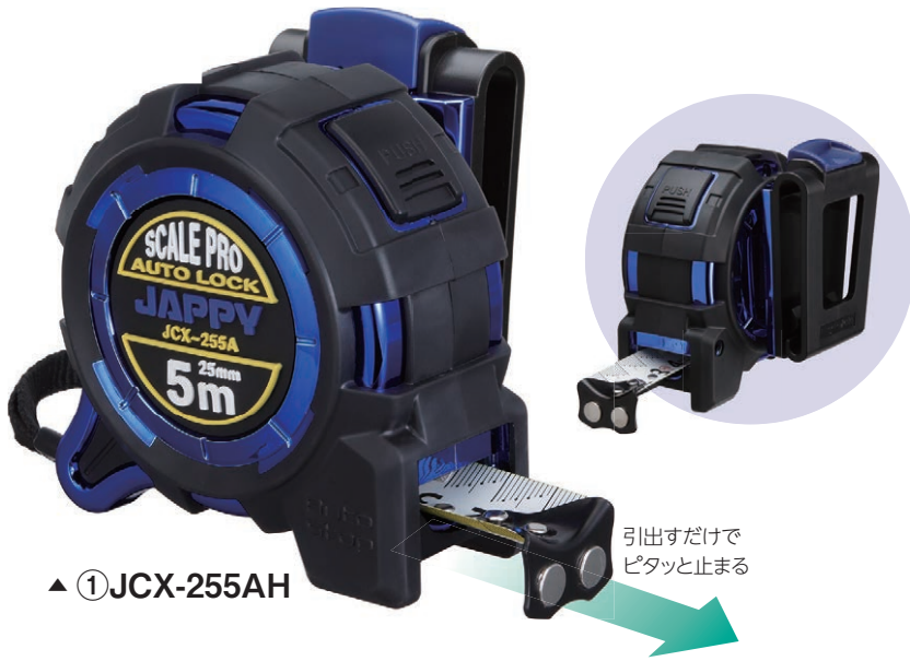
▲ ① JCX-255AH