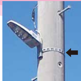
JAPPY防犯灯設置の使用例