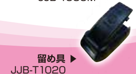
留め具 ▶ JJB-T1020