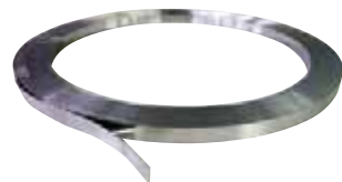
▲ バンド (10mm幅50m巻/20mm幅50m巻) SUS430: JSB-□□50M SUS304: JSB-□□50MS