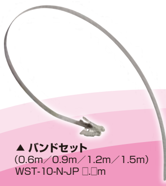
▲ バンドセット (0.6m/0.9m/1.2m/1.5m) WST-10-N-JP □□m