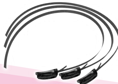
▲ バンドセット (0.6m/0.9m/1.2m/1.5m) PES-10-JP □□m