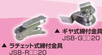
▲ ギヤ式締付金具 JSB-G□□20 ▲ ラチェット式締付金具 JSB-R□□20