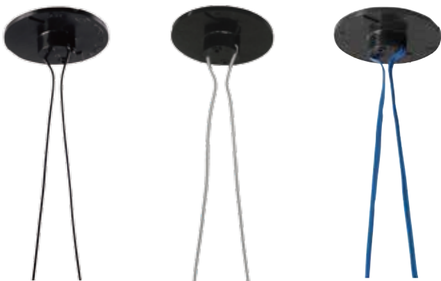
PP19B-JB (260mm黒バインド線) PP19W-JB (260mm白バインド線) PP19V-JB (220mm青ビニタイ)